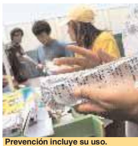
Prevención incluye su uso.

Recordó que en nuestro país se registran 600 mil embarazos no deseados por año, cifra que podría disminuir